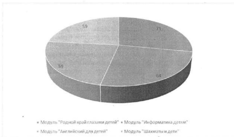
Рис. 2. Количество педагогов, реализующих дополнительную общеобразовательную программу по социально-коммуникативному и познавательному развитию «Современные дети»

Количество штатных единиц педагогов дополнительного образования, необходимых для реализации Программы, составило в этом году 30.