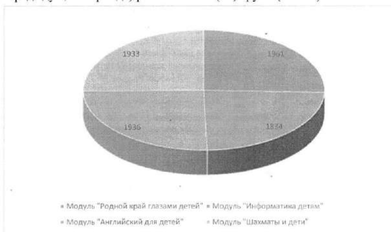
Рис. 1. Количество детей, принимающих участие в Модулях Программы

- в модуле «Шахматы и дети» участвуют 1933 (на 589 участников больше, чем в предыдущем периоде) ребенка из 90 (59) групп (35 ОО).